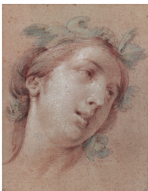
J.591.124 Tête d'Antiope, pstl/ppr bl.-gr., 39.2x31.1 (Babault; Paris, Picard & Glomy, 24.I.-5.II.1763, Lot 400, 23 livres 6 sols; Louis-Antoine-Auguste, duc de Chabot (1733–1807); Paris, Le Brun, 10–15.III.1787, Lot 187, 37 livres; princesse Galitzine. Paris PC; London, Christie's, 7.VII.1998, Lot 199 repr., est. £20–30,000; Paris, Drouot, Tajan, 6.VII.2001, Lot 113 repr., est. Fr60–80,000, Fr92,000; Geneva PC 2009). Lit.: Aaron 1993, no. 32; Lesur & Aron 2009, no. D.257 repr. bw; p. 468 n.r. [does not link Babault and Chabot records]. Étude pour Une nymphe et un satyre , dit Jupiter et Antiope , pnt. (Prado inv. 3218) Φσ