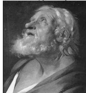
.J591.119 Tête représentant la Poésie, pstl, Salon de 1748, no. 43

.J591.12 Une belle tête de femme, pstl vigoureusement coloré, 48.6x39.2 (Cottin; Paris, Grignard, Helle et Glomy, 27.XI.–22.XII.1752, Lot 337, 22 livres; Glomy). Lit.: Lesur & Aron 2009, p. 468 n.r.