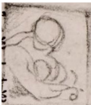
J.5268.104 Femme portant un mantelet rouge bordé de fourrure, pstl, 58x47 ov., sd ← “J.-J. Médard 1771” (Eugène Kraemer; Paris, 2–5.vi.1913, Lot 124 repr.) Φ

J.5268.102 Un avare, la tête nue, habillé d’une robe de chambre, appuyé sur une table où sont plusieurs sacs d’argent, pstl, touché avec liberté (M. [Chevalier]; Paris, hôtel d’Aligre, Florentin, Paillet, 26–27.xi.1779, Lot 37, 15 livres. Paris, Copreaux, 20.iii.1780 & seq., Lot 115)[sketch Saint-Aubin 1779 cat.]